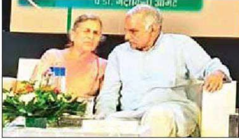
मंचावर उपस्थित डॉ. प्रकाश व मंदाकिनी आमटे

ईसीई इंडिया कंपनीद्वारे ५ व्या वर्धापन दिनाचे औचित्य साधून संत ज्ञानेश्वर सांस्कृतिक भवन येथे मानवसेवा ऊर्जा पुरस्कार वितरण सोहळा शनिवारी आयोजिण्यात आला होता. त्यावेळी ही प्रगट मुलाखत झाली. अनुभव सांगताना पद्मश्री प्रकाश आमटे म्हणाले, आयुष्यामध्ये समोर आलेल्या परिस्थितीला स्वीकारून त्यामध्ये समाजाभिमुख बदल करण्यावर भर दिला. शिक्षणानंतर वैद्यकीय सेवेचे व्रत जोपासताना समाजसेवेला प्राधान्य दिले. या सेवाकार्यामध्ये